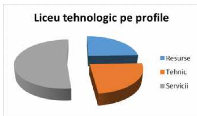
Distribuția elevilor pe domenii și calificări, COAL PROFESIONAL, an școlar 2021 – 2022